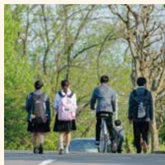
#帰宅というミッション