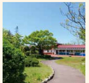
#雑草たちのいるところ