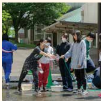
#やわらかないのちたち