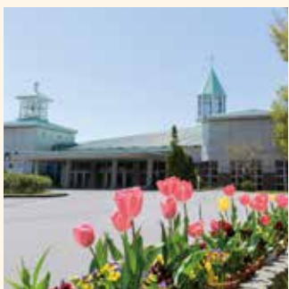
#チューリップ大行進