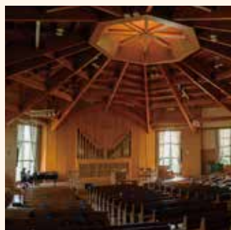
#静寂という名の音楽満ちて